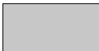
1200x590 mm liggande montage